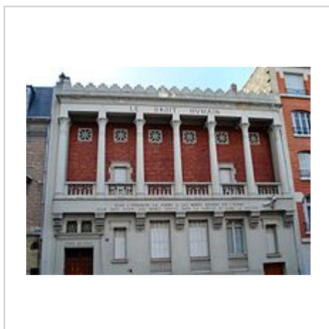
Le bâtiment historique, 5 rue Jules-Breton (13 e arrond. de Paris).

L'Ordre maçonnique mixte international « le Droit humain » est constitué le 11 mai 1901 par la création du Suprême Conseil. Un convent international est prévu en 1914, mais la guerre empêchera de le réunir. C'est lors du 1 er convent international de Paris, en août 1920, réunissant 300 loges de France (et des colonies), des États-Unis, des Pays-Bas, d'Italie, de Grande-Bretagne et de Suisse, que l'Ordre maçonnique mixte international « le Droit humain » voit officiellement le jour et lors duquel les délégués votent et approuvent la constitution internationale qui régit l'Ordre 4 .